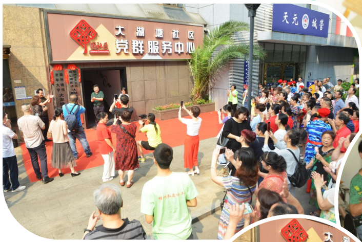
▲揭牌后,葫芦丝、剪纸与传统手工艺、太极拳等三堂公开课,吸引了不少市民参与