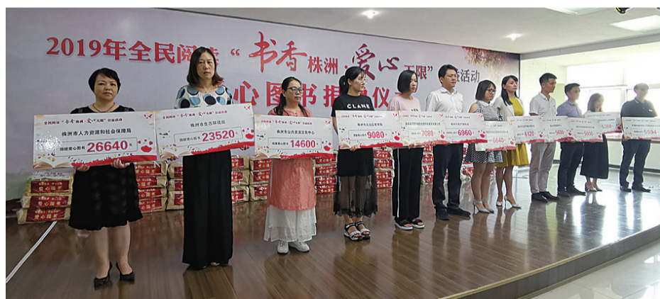
▲爱心图书捐赠仪式现场

本报讯(记者 肖蓉)昨日上午,2019年全民阅读“书香株洲·爱心无限”公益活动爱心图书捐赠仪式在新华书店株洲公司举行。全市共有356家单位参与爱心捐赠活动,购置爱心卡345万元,新华书店将提供爱心捐赠书籍138万元,赠与偏远的社区和学校等地。