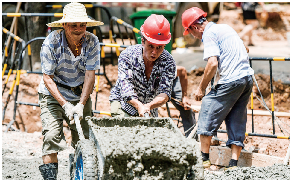
阳光很烈 他们很美 致敬高温下的劳动者

8月18日，在天元区一小区改造工地，建筑工人顶着烈日铺设水泥道路。气象台发布专报称，截至18日，株洲本月已有16天气气温超35℃。这一周，市区有6天最高气温达38℃。