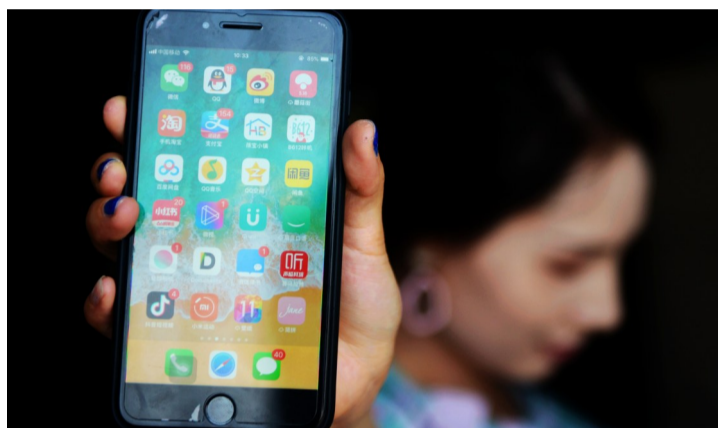
▲各类APP占满了手机多个页面

使用手机APP,你拖了“全国人民”的后腿吗?记者日前调查发现,年轻人手机APP安装数量大都超出人均数。在我们身边,与株洲市民相关的APP也相当丰富。