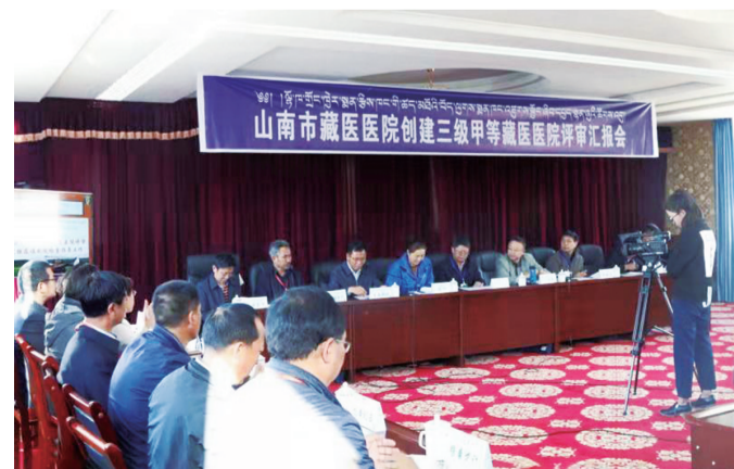
▲创三甲评审汇报会现场

通过一年时间的“巧干”+“苦干”,2017年9月山南市藏医院成功创建国家“三甲甲等民族医院”,成为山南市第一家“三甲甲等医院”,西藏自治区第二家国家“三甲甲等民族医院”。