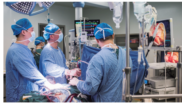
▲全胸腔镜心脏外科手术