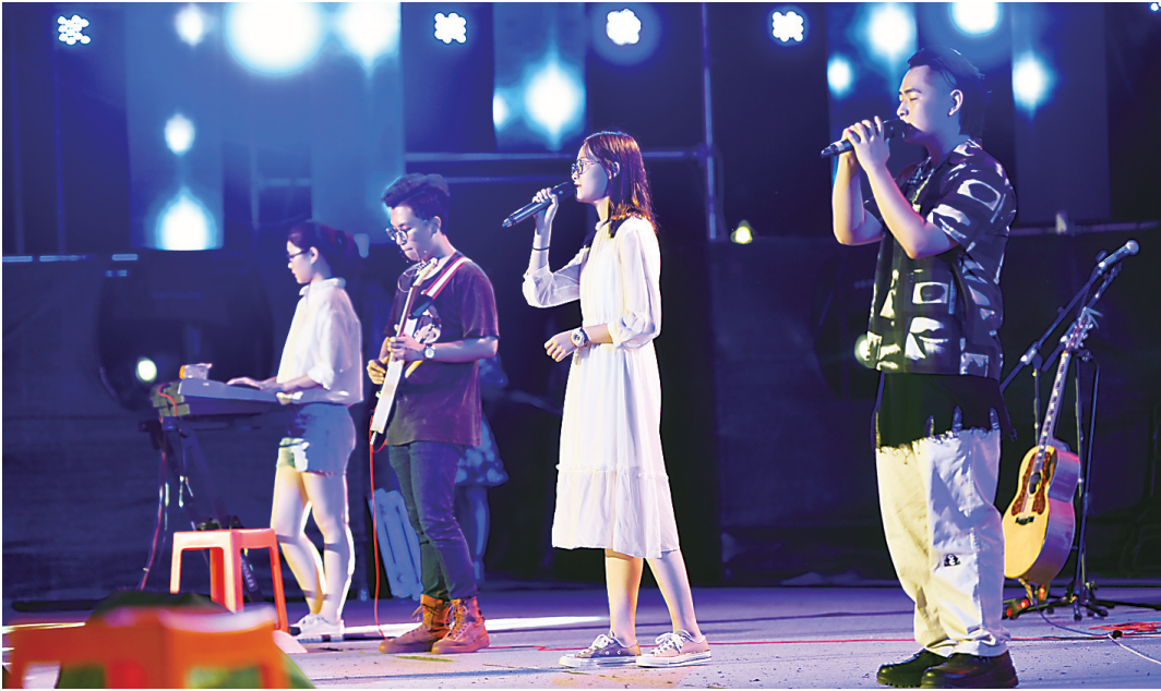
▲音乐会现场