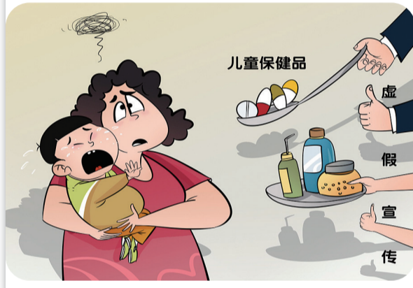
漫画:谨防忽悠 曹一作