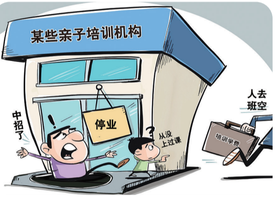
漫画:坑 新华社发 王鹏作

格陵兰鲨鱼以其丑陋外表与动作缓慢著称,其最短寿命是272年。它们的体长可以生长到7.3米,体重可达1.5吨。在冰岛,格陵兰鲨鱼被认为是一种当地的民族美食。