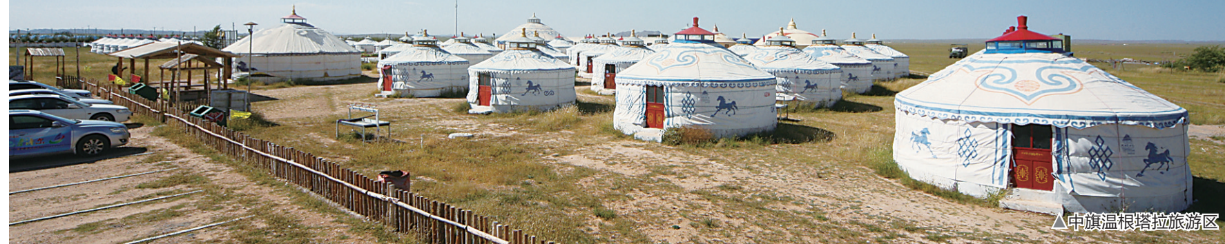
▲中旗温根塔拉旅游区