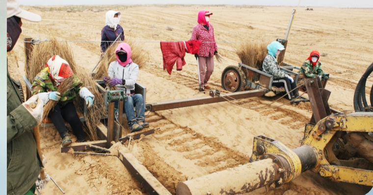
▲乌兰布和沙漠植树