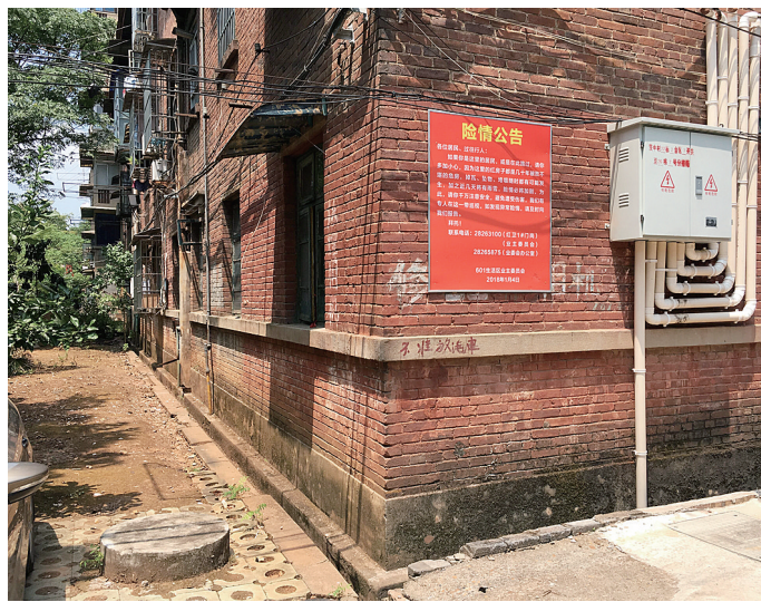
老房外墙张贴险情公告。