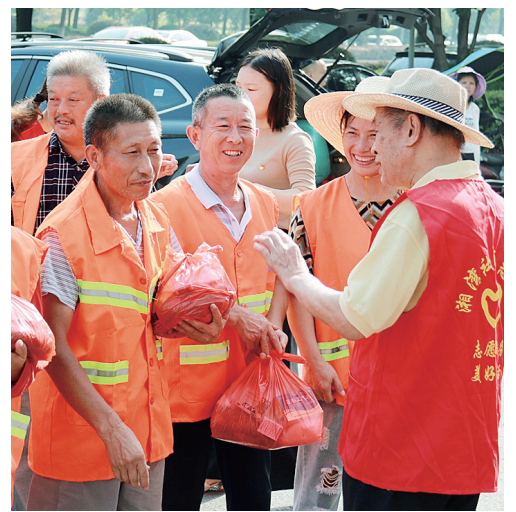
环卫工人笑纳“清凉礼包”。

“大家累了、渴了,可以随时来居委会歇歇脚。”湘湖社区党支部书记表示,居委会也是环卫工人的“驿站”,同时,居委会将加强宣传,呼吁居民不要乱扔垃圾,用实际行动减轻环卫工人负担。