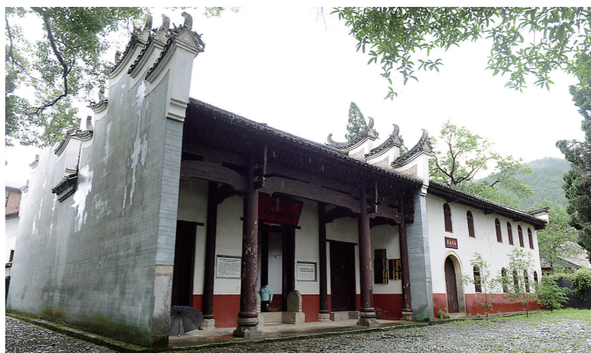
周家祠(含周南学校)位于炎陵县中村村,1928年3月,毛泽东曾在此主持召开井冈山革命根据地第一次插牌分田联席会议。

“我们的目标是,力争通过2年的努力,将中村建设成为享誉全省乃至全国的‘炎陵黄桃小镇’。”谭湘东说。