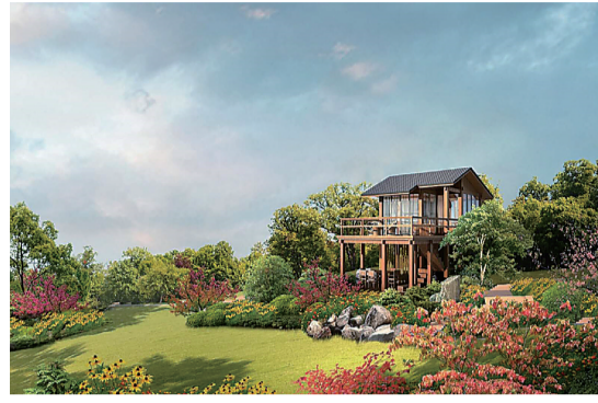
响水村民宿效果图