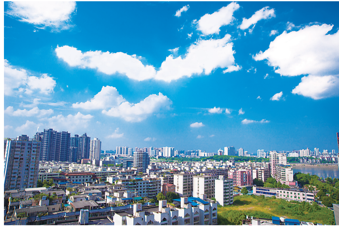
▲8月13日上午,雨后的株洲空气质量良好,蓝天白云,令人心旷神怡