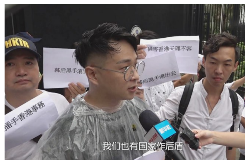
▲香港市民接受新华社记者的采访

针对媒体报道美国会参议院共和党领袖麦康奈尔等日前发表“暴力镇压不可接受”“北京侵蚀港人自治和自由”等错误言论,外交部驻香港特别行政区特派员公署发言人13日表示,美国会有关议员无视事实,颠倒黑白,毫无根据地诋毁中央和特区政府,向极端暴力分子发出严重错误信号,中方对此表示强烈不满和坚决反对。