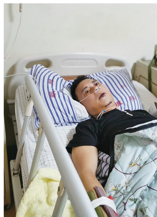
杨先生正在医院接受治疗