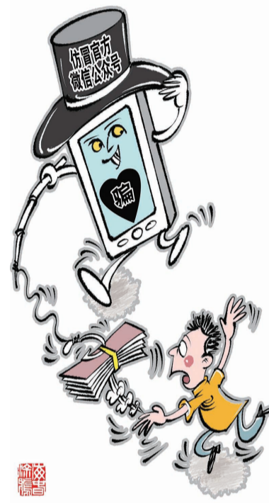
漫画:“钓鱼”诈骗 商海春 作

微信官方团队回应,平台现在对公众号涉及“银行”这一类的命名,均严格要求申请者提交相关金融资质才可命名;上文提到的“银行卡安全助手”公众号属于注册时间较早的账号,平台已要求其7天内改名或更换有资质的主体,如到期未调整,将直接清空名称。