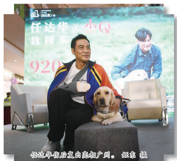
任达华伤后复出亮相广州。

本报综合消息 8月11日,“任达华‘我回来了’暨电影《小Q》重聚会在广州举行。这是该片主演任达华伤后首次与公众见面。