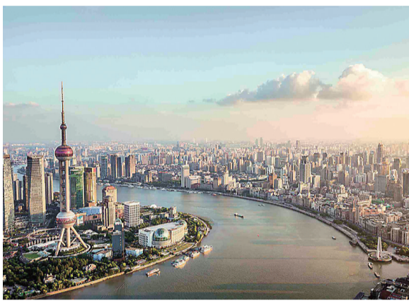
繁荣富强的今日中国。

时光荏苒, 岁月如歌。新中国70年, 在人类历史长河中只是短暂一瞬, 在中华民族发展史上也是弹指之间, 却如此深刻地改变了中华民族和中国人民的命运。我们的祖国从来没有像今天这样欣欣向荣、蒸蒸日上; 我们的民族从来没有像今天这样扬眉吐气、自信满怀; 我们的人民从来没有像今天这样幸福安康、意气风发。忆往昔峥嵘岁月稠, 中华大地沧桑巨变, 换了人间! 用手机微信“扫一扫”功能扫码观看视频, 和我们一起进入时光隧道, 共同穿越70年。