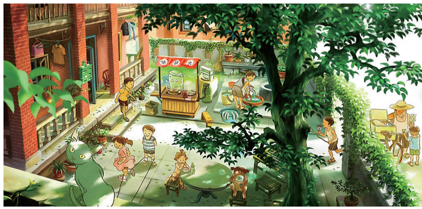
儿时的夏日, 是每个人心底的柔软记忆。