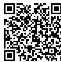
▲晚报乐活周刊微信群

特别提醒:本刊登载的文章、美术作品均有稿酬(纸质版、电子版、微信版稿酬合一),凡未收到稿酬的作者,请与本刊编辑部联系。作者如无特殊声明,即视为同意授予本刊及本刊微信版、本刊合作网站信息网络传播权,本刊支付的稿酬包括此项授权的收入。