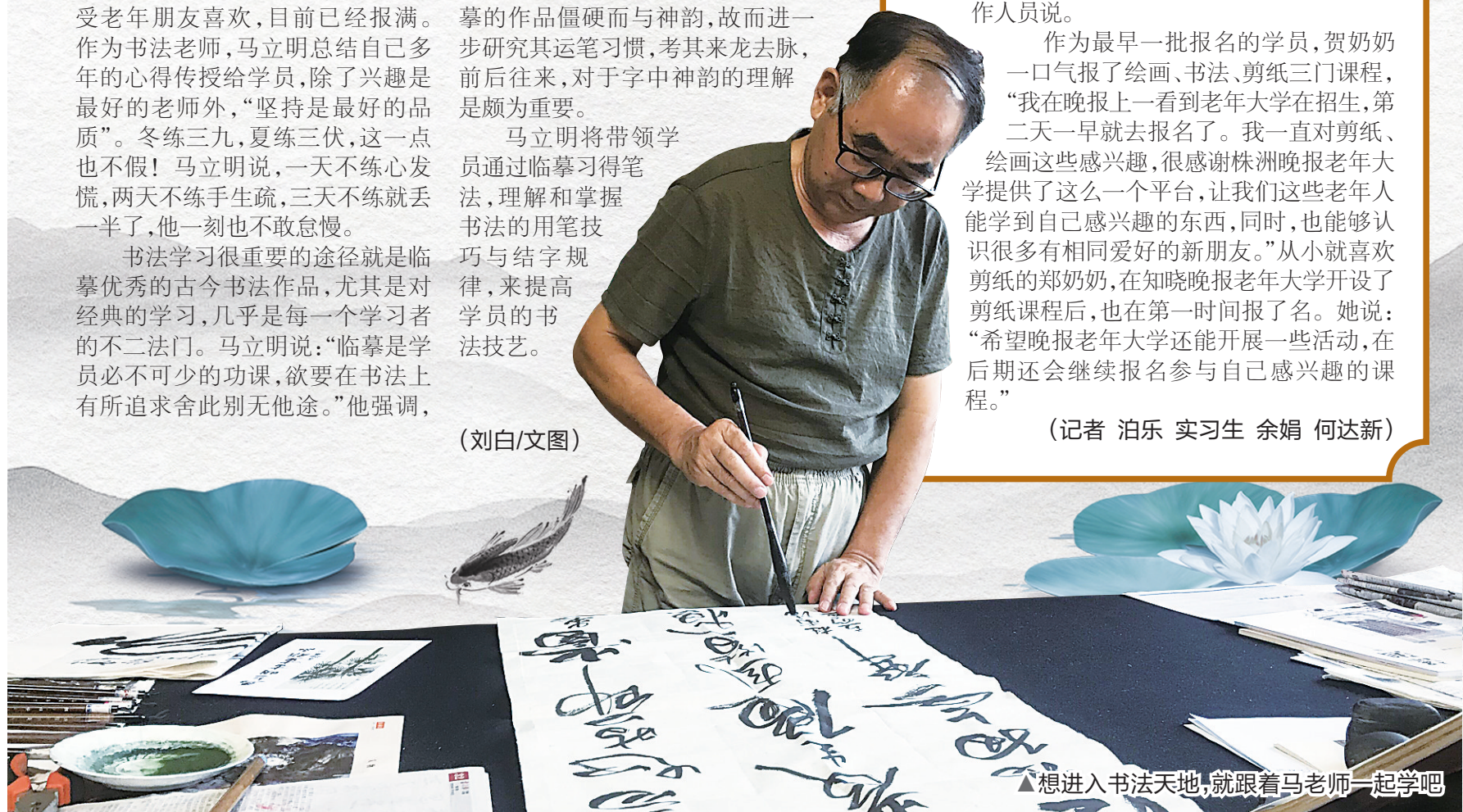
▲想进入书法天地,就跟着马老师一起学吧