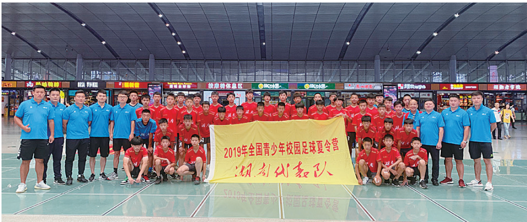
▲2019年全国青少年校园足球夏令营湖南代表队合影

本报讯(记者 何春林 通讯员 侯文波)7月24日至29日,2019年全国青少年校园足球夏令营第六营区(初中组)选拔赛在贵州遵义市举行。我市4名足球小子入选全国青少年校园足球夏令营第六营区最佳阵容。