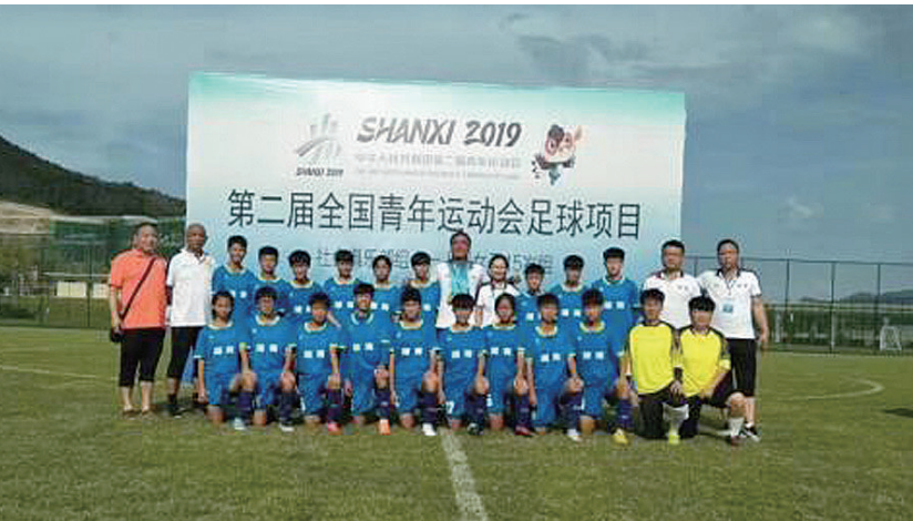
▲8月5日,株洲市狼腾足球俱乐部女子U15精英队赛场合影

本报讯(记者 何春林 通讯员 侯文波)8月5日,株洲市狼腾足球俱乐部女子U15精英队夺得全国第二届青年运动会社会俱乐部女子U15组别冠军,这是株洲获得的第一个全国性综合运动会足球冠军。