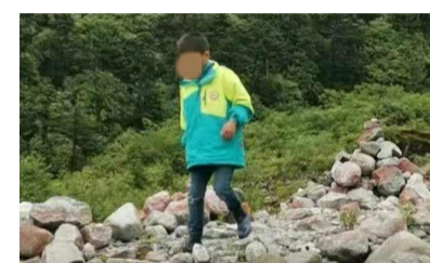
孩子的母亲说,孩子失联地点在景区的红谷滩,“我当时在俯身捡石头,他离开我视线的时间很短。”

湖北一名8岁男孩在四川海螺沟森林公园失联,搜寻6日未果。8月8日,孩子的母亲告诉新京报记者,孩子失联时距离自己只有十几米,一不留神便看不见孩子的踪影。