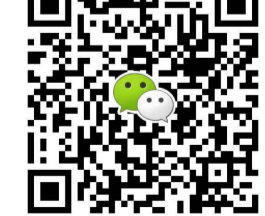
扫一扫上面的二维码加关注,如有疑问