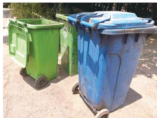
绿色蓝色混搭，市民有点搞不清。