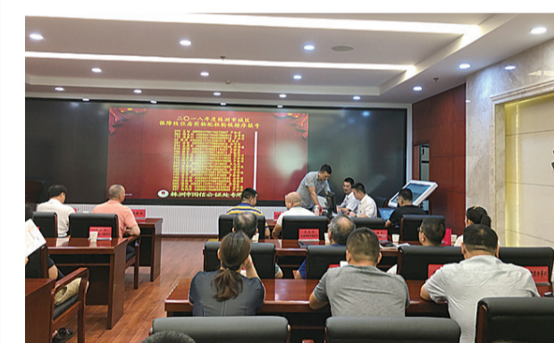
▲公开摇号现场

本报讯(记者 周嵩 通讯员 袁思诗 张薇)昨天上午,在市房地产大厦5楼多功能厅,我市2018年度城区新增城镇公租房实物配租申请家庭进行了公开摇号,通过资格审查并经公示符合条件的762户申请家庭,通过摇号确定了各自的实物配租轮候顺序。 此次摇号范围包括2018年1月1日至2018年12月31日期间,城区所有申请公共租赁住房实物配租且已通过资格审核符合保障条件的家庭。 为了保证公开、公平、公正,参加公开摇号的762户申请家庭均通过了街道办事处、区政府、市住建局的三级审查,以及“住房保障对象准入和分配信息系统监督平台”的信息对比,并通过《株洲日报》《株洲晚报》等媒体公示。 按照《株洲市公共租赁住房保障管理办法》(株政办发[2016]32号)的相关规定,上述家庭分为5个批次分别摇号:单独批次4户,为国有土地上房屋征收、企业破产改制、危房搬迁、棚户区改造、自然灾害事件中符合保障条件的家庭;普通第一批次164户,为低保家庭、分散供养的特困人员及保障家庭中有三级以上(含三级)残疾人、重大疾病患者、70岁以上老人、军烈属、优抚对象、市级以上劳动模范、失独家庭等情形之一的家庭;普通第二批次568户,为其他城镇低收入住房困难家庭;普通第三批次4户,为城镇非低收入住房困难家庭中有三级以上(含三级)残疾人、重大疾病患者、70岁以上老人、军烈属、优抚对象、市级以上劳动模范、失独家庭等情形之一的家庭;普通第四批次22户,为其他城镇非低收入住房困难家庭。 通过公开摇号确定的轮候顺序,详见本报今日A06、A11版。