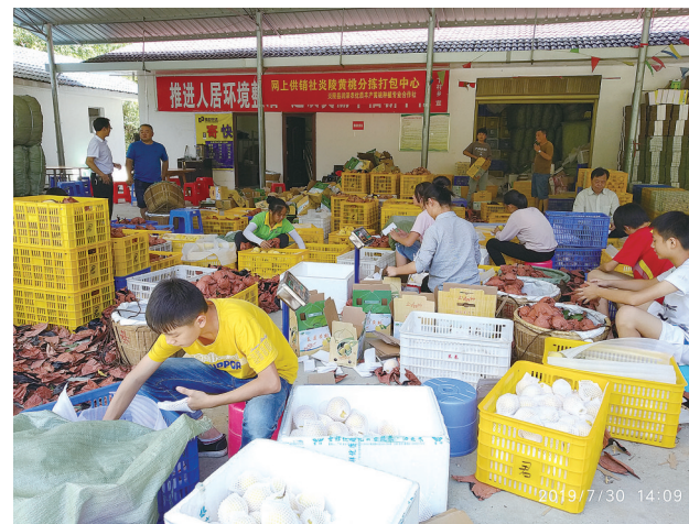
员工们正忙着分拣“炎陵黄桃”。