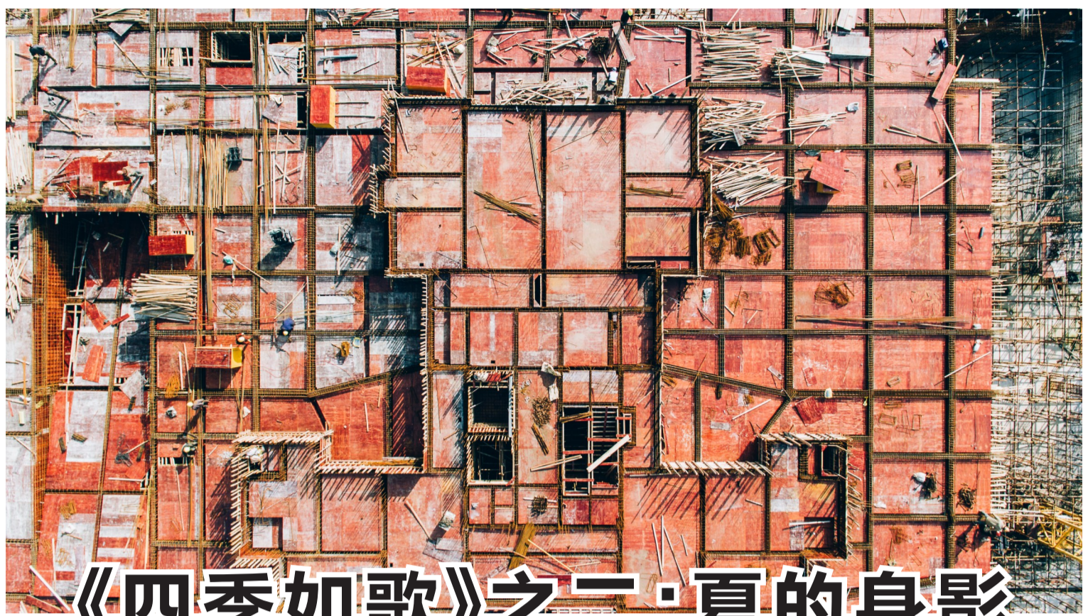
▲衡山路旁的建筑工地,27℃,工人们轮班作业。