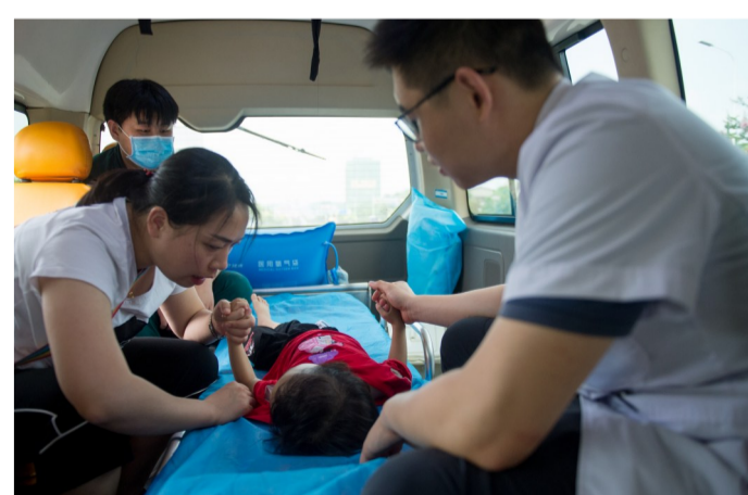
▲宝贝坚持住,妈妈和医生叔叔就在边上。