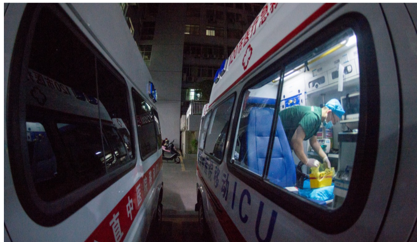
▲凌晨两点,刚刚抢救过来一位伤者,护士抓紧时间清理救护车。

接警、派车、出诊,看似简单的程序中,却是一场时间与生命的赛跑。伴着急促的警笛声,他们穿梭于城市的各个角落,春夏秋冬,分秒必争,只为给病人争取治疗时间。