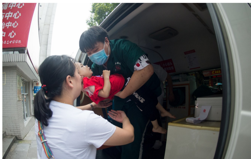
▲急救车刚到医院,火速把患者送入病房。