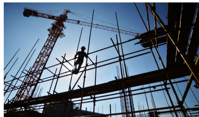
▲荷塘区一工地上,36℃,建筑工人在搭建脚手架。