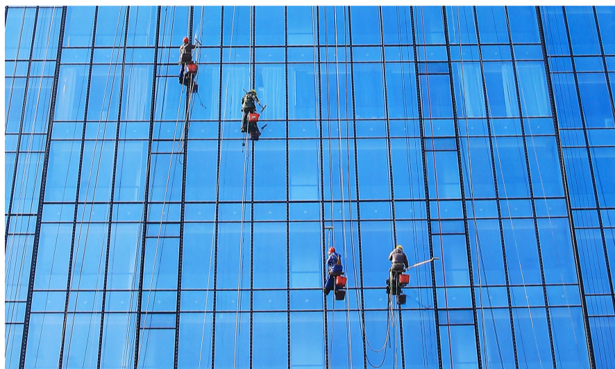
▲高新区的高楼,36℃,“蜘蛛人”清洗外墙。