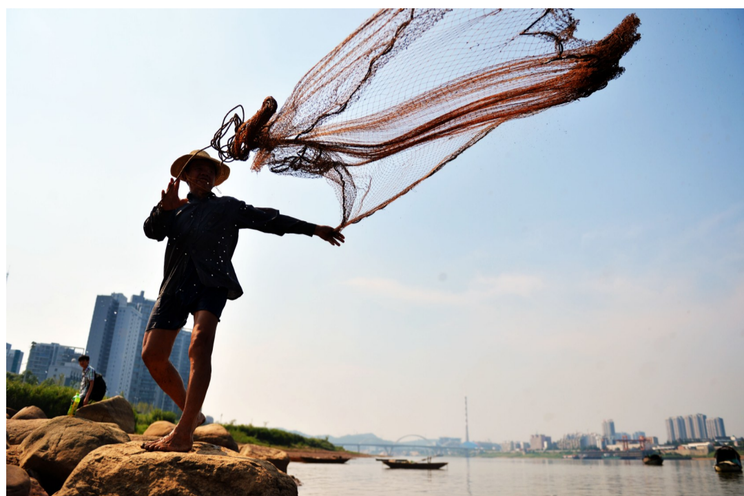
▲湘江边,36℃,渔夫奋力撒网。