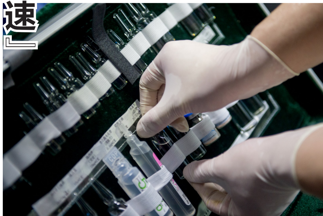
▲每次急救车出完车,医生总会在第一时间补充药物。