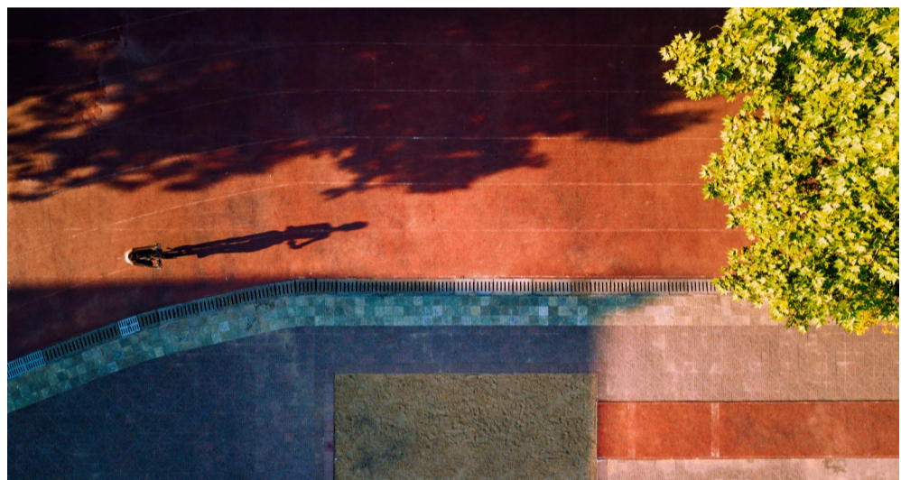
▲天元中学操场,35℃,骑车上班的老师。

高温下的坚守,意味着用汗水换来城市美好的明天,每一个劳动者的身影,都是一个美丽的场景。辛勤的付出,忘我地劳作,挥洒出的汗水,汇聚成一幅幅有温度、有热度的夏日画卷。