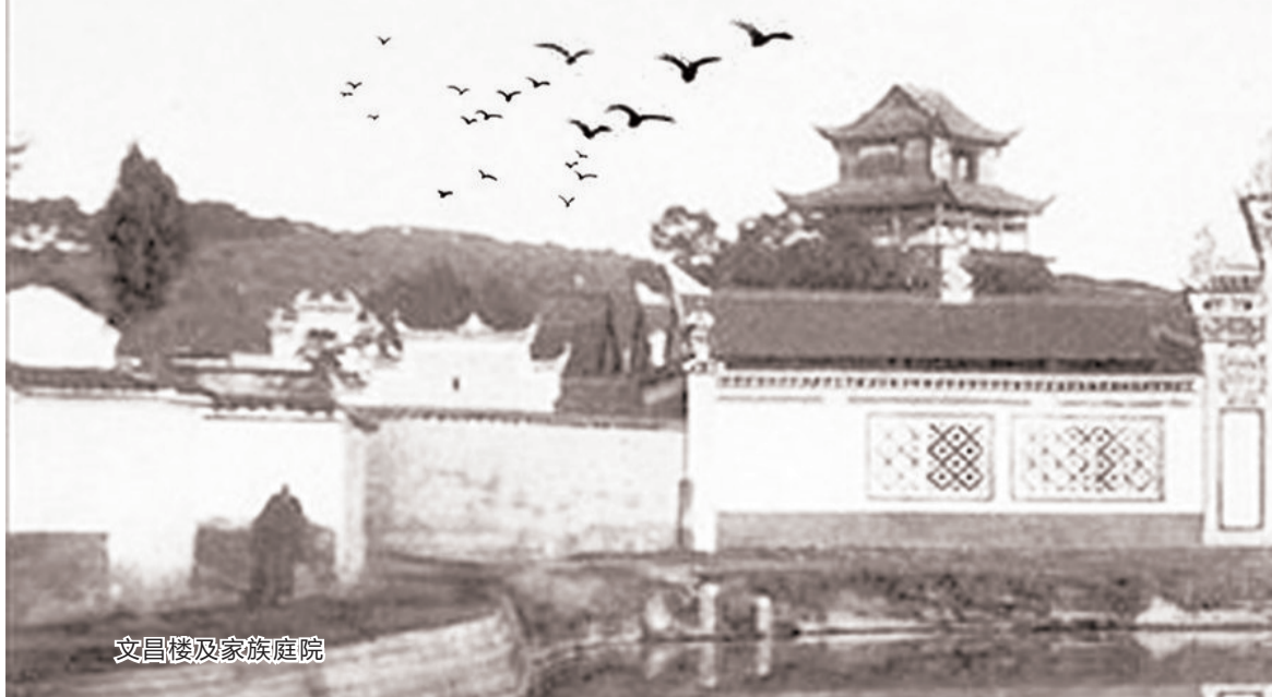
文昌阁及家庭庭院