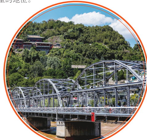
解放军在解放兰州战役中曾浴血抢占中山铁桥。

兰州古称金城，因其地处中原进入西域的咽喉要道，群山环抱，固若金汤，因此取“金城汤池”之意，喻其坚固。在兰州近现代发展历程中，众多的湖湘儿女有幸踏入这座黄河之都，演绎着风采各异的金城情缘。其中，左宗棠、彭德怀、辛树帜这三位湘人，在兰州的历史记忆里，有着举足轻重的地位。