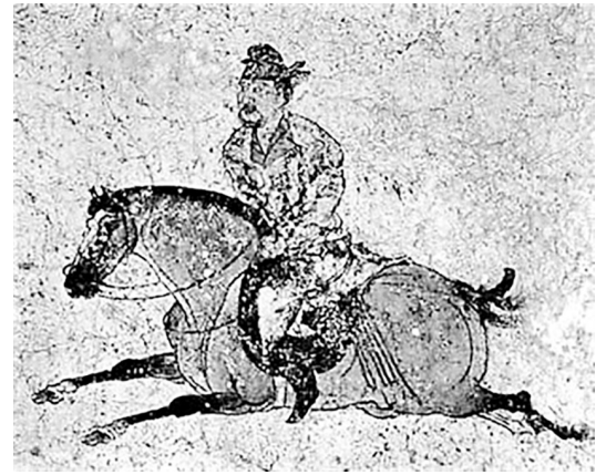
▲唐代壁画中的神策军军官