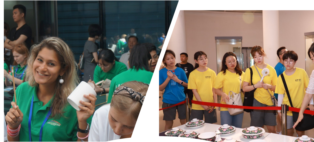
▲俄罗斯友人在绘制陶器