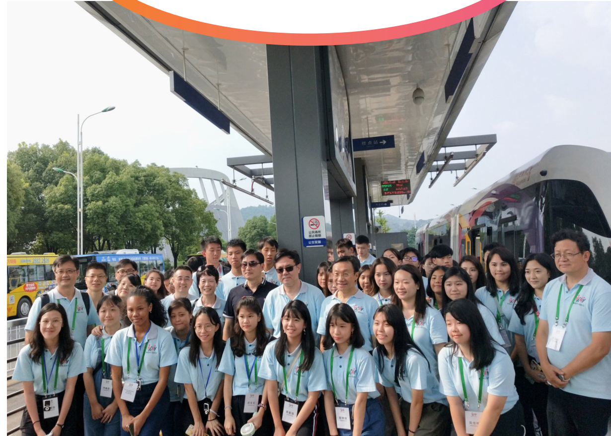
▲澳门同胞体验株洲智轨并合影留念