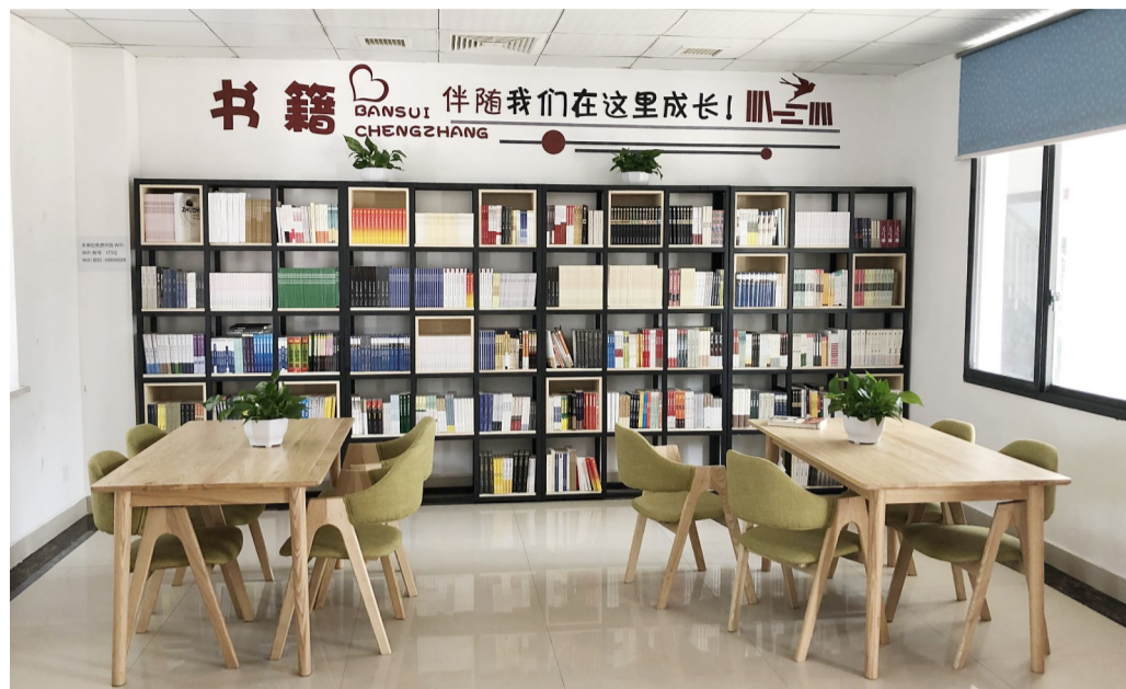
▲龙头社区图书室