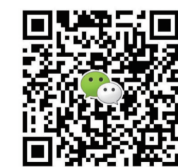
扫一扫上图二维码,添加微信