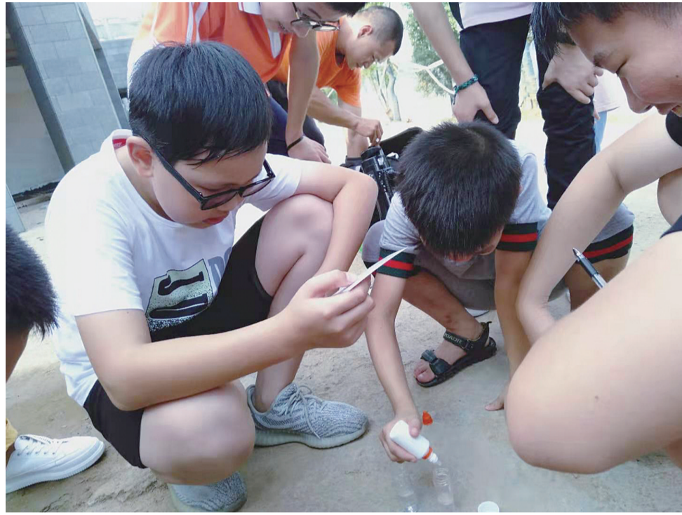
参与活动的孩子们,正在认真进行水质检测

“孩子们在趣味活动中感受自然之美,通过亲身参与认识到保护环境人人有责,从小做起。”王慧鹏说,“水质检测就是让孩子和家长了解自家饮用水的安全度,了解保护水资源是多么重要。”