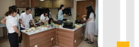
评委为菜品打分。