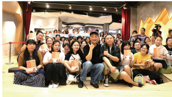
姚谦与株洲粉丝们合影。