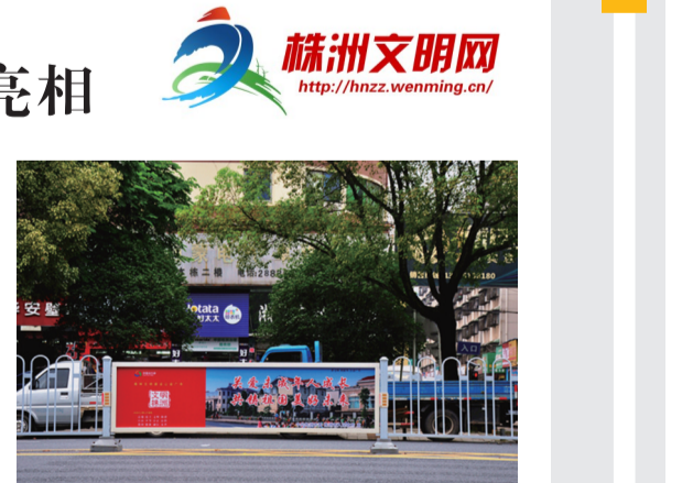
株洲黄河北路隔离护栏上的公益广告。

在天元区黄河北路记者看到,沿线的道路隔离护栏每隔25米就会装上一块公益广告,每张公益广告上都配有一句文明标语。这些公益广告如同一张张灵动的城市文明标签,成为城市主干道上的一道靓丽的风景。“公益广告宣传是文明城市建设的重要