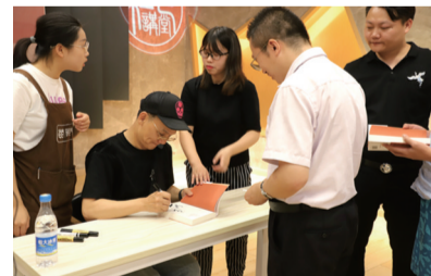
新书签售现场。