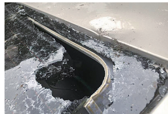
▲东方花园小区,外墙瓷片脱落砸坏车子玻璃

湖南天桥律师事务所律师邱凌云介绍,依据《侵权责任法》第八十五条规定,建筑物、构筑物或者其他设施及其搁置物、悬挂物发生脱落、坠落造成他人损害,所有人、管理人或者使用人不能证明自己没有过错的,应当承担侵权责任。而贴在外墙的瓷片本来就是构筑物,其脱落造成了损失,无论是物业公司,还是业主委员会,须证明自身没有过错,比如已经做了隔离措施等可以免责。否则应当承担责任。