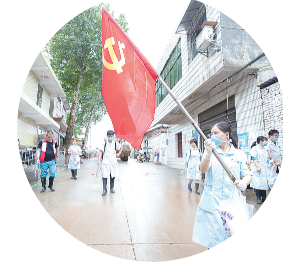
醴陵市防疫消毒小分队支援重灾区石亭镇。