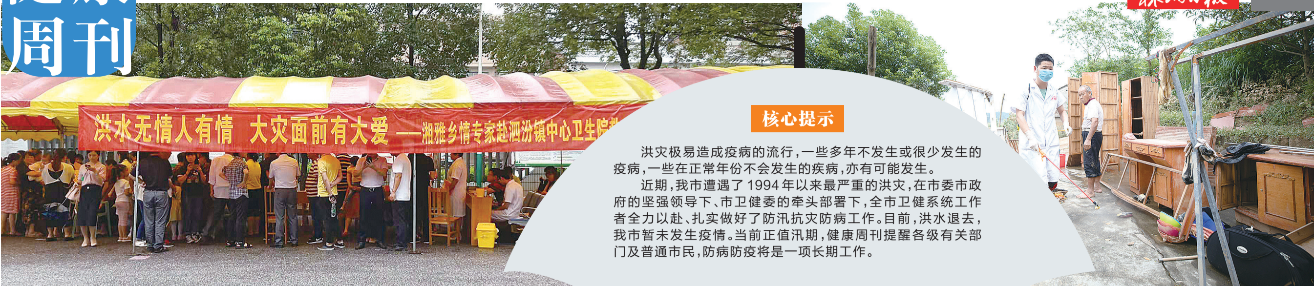
湘雅乡情专家在灾区义诊。