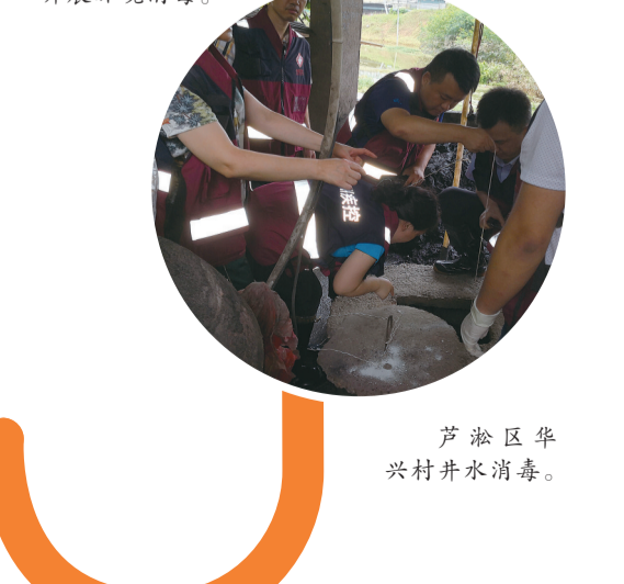
芦淞区华兴村井水消毒。