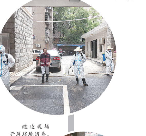
醴陵现场开展环境消毒。