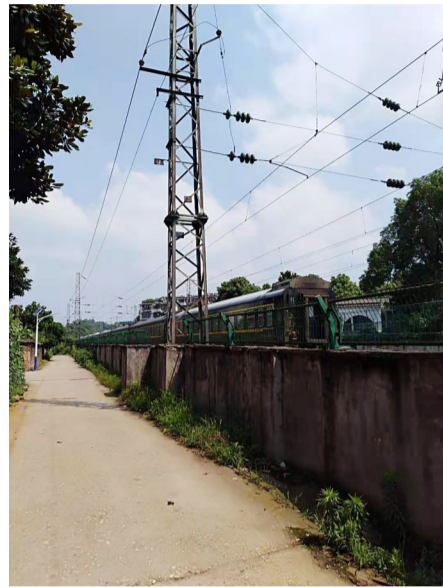
▲湘天桥社区铁路沿线装上了新路灯