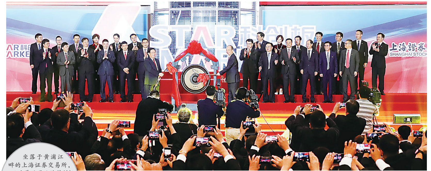
▲科创板首批公司上市仪式现场

坐落于黄浦江畔的上海证券交易所,22日为举世瞩目的科创板鸣锣开市。伴随首批25家上市公司率先“试水”,中国资本市场为助力科技创新吹响“冲锋号”。