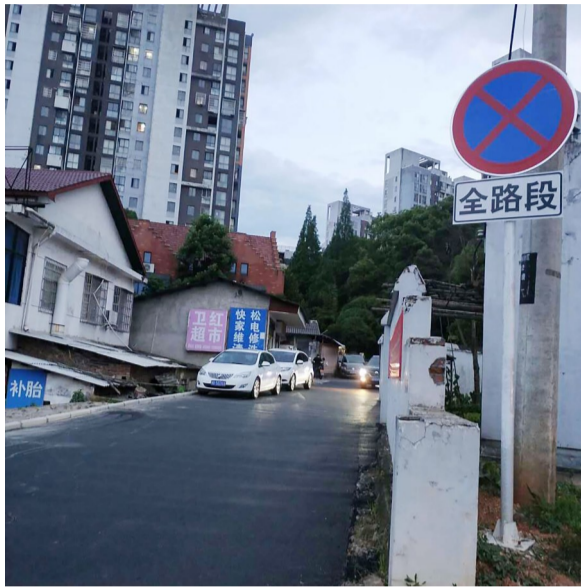
▲莱茵小镇门口原本坑洼的道路被修缮一新