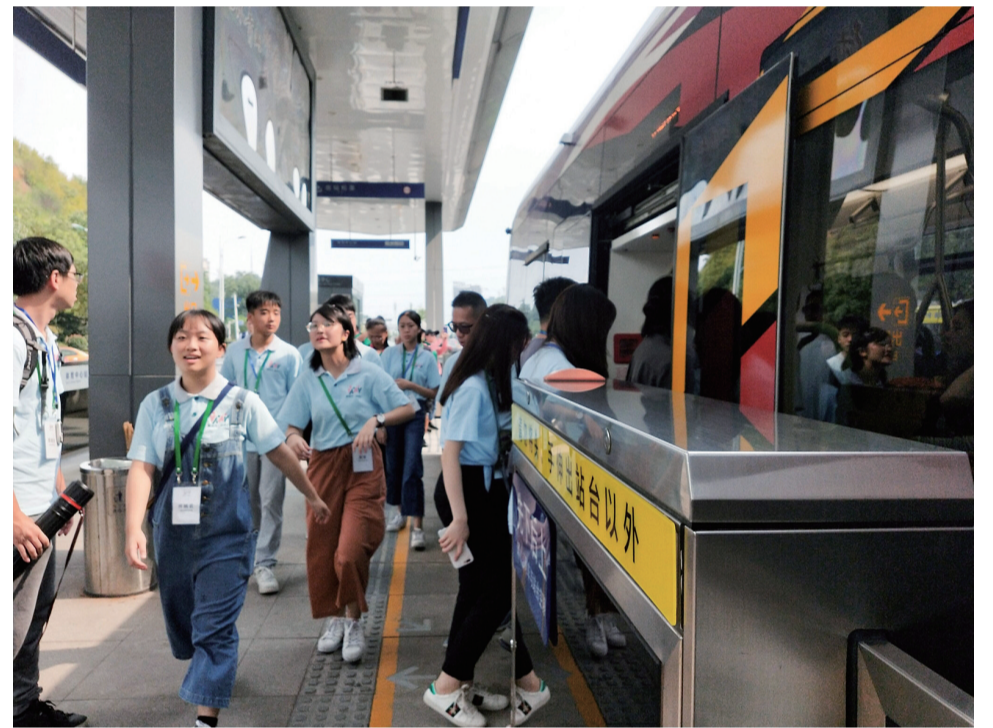
澳门青少年学习参访团在株洲。