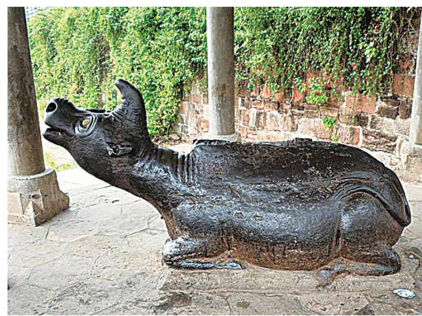
卧于茶陵古城墙下的“南浦铁犀”