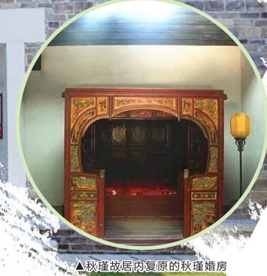
▲秋瑾故居内复原的秋瑾婚房