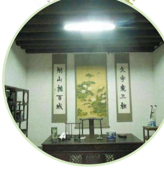
秋瑾故居内复原的秋瑾书房