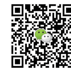
扫一扫上面的二维码加关注