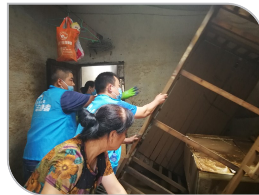
▲志愿者帮受灾居民搬家具