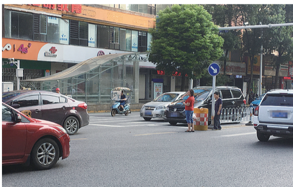
▲昨日上午,行人在钻石路口横穿马路

荷塘交警大队副大队长周毅介绍,一直以来,钻石路口行人横穿马路的现象都很普遍。“路口附近有月塘菜市场,还有湘运汽车站,大部分横穿马路的都是出来买菜的老年人,还有一部分是进出汽车站的乘客。”周毅介绍,下一步,对于不听劝导依然横穿马路的行人,交警部门不仅会通过媒体曝光,还将按照《道路交通安全法》对其处以20元的罚款。