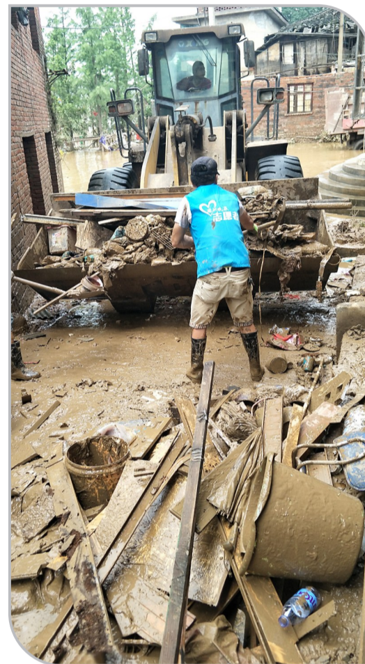
▲弘驹志愿者在街道上清除淤泥