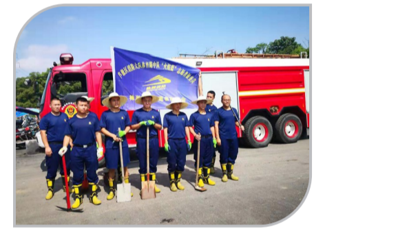
▲晚报志愿者联合会“火焰蓝”志愿服务队