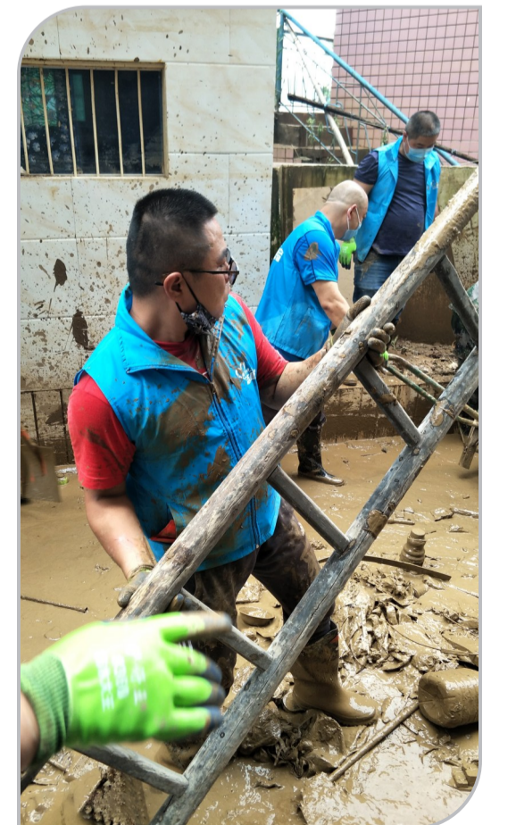
▲志愿者在清淤现场冲锋在前