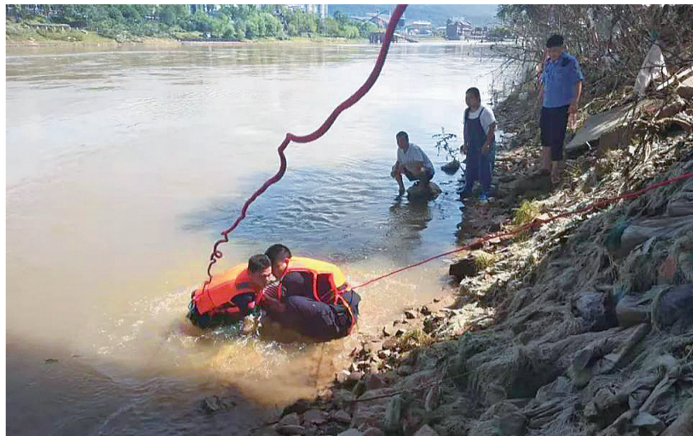
▲快警队员下水救人