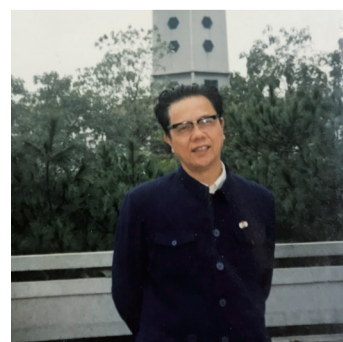
▲作者1991年着中山装登高照