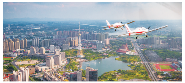
株洲,我们的家园。