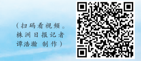
(扫码看视频。株洲日报记者 谭浩瀚 制作)