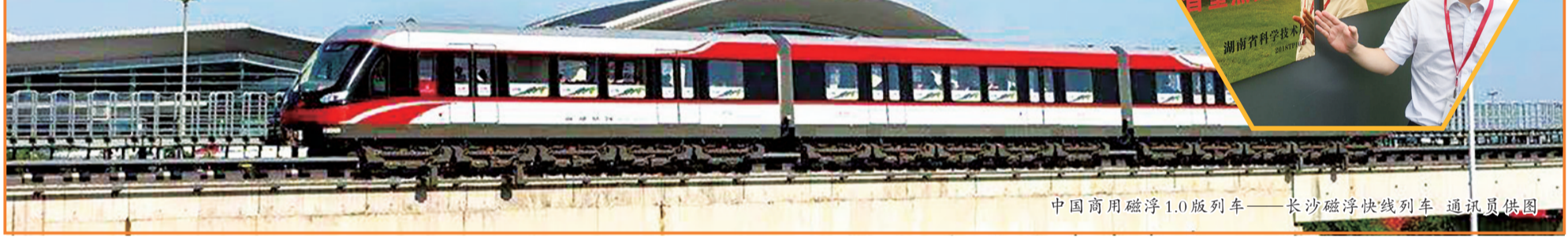
中国商用磁浮1.0版列车——长沙磁浮快线列车

长沙磁浮快线自开通试运营以来,吸引我国近30个城市实施或计划实施磁浮项目,来自35个国家和地区的200多个考察团