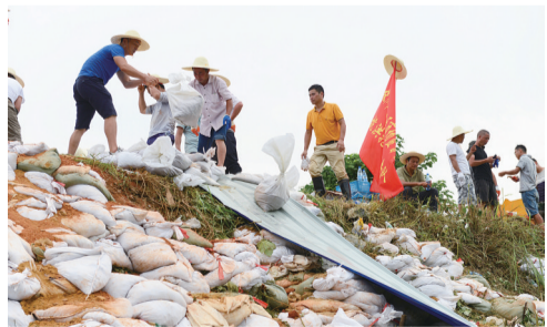
在涠口区涠田镇,干部群众对开裂下沉的堤坝进行加固、引流。

7月6日以来,伴随着持续强降雨,株洲各地相继遭遇暴雨洪水灾害。茶陵、攸县、醴陵、天元、涠口等县市区纷纷告急。应急、水利、水文、气象等部门连续通宵作战,攸县、茶陵、天元、涠口等地干部群众同德同心,日夜奋战在防汛抗洪抢险一线。直升机、冲锋舟、皮划艇……立体式救援首现株洲,受困群众得到及时转移。江水漫堤,军民昼夜值守,抢险堤坝。京广铁路发生管涌,基地辅警不顾危险跳入水中堵涌,确保交通大动脉安全……全市机关干部放弃本双休日休息,所有人员坚守防汛岗位,发扬连续作战、攻坚克难、不怕疲劳的顽强作风,众志成城鏖战洪魔,携手同心重建家园。用手机微信“扫一扫”功能扫码观看视频,为向水而行的英雄们点赞。(文/唐剑华 视频/火龙果)