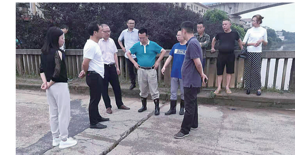
▲工作人员在现场查看桥梁北段逐渐扩大的伸缩缝

本报讯(记者 戴凇 通讯员 郭力嘉 刘颖)“市交通质安处,走沙港桥出现险情,请速派员协助处理”。7月13日一大早,市交通质安监督处值班室接到市防汛指挥部技术指导组的加急电话,该处随即派出技术指导组,带齐相关设备,驱车奔赴事发地,查看险情。