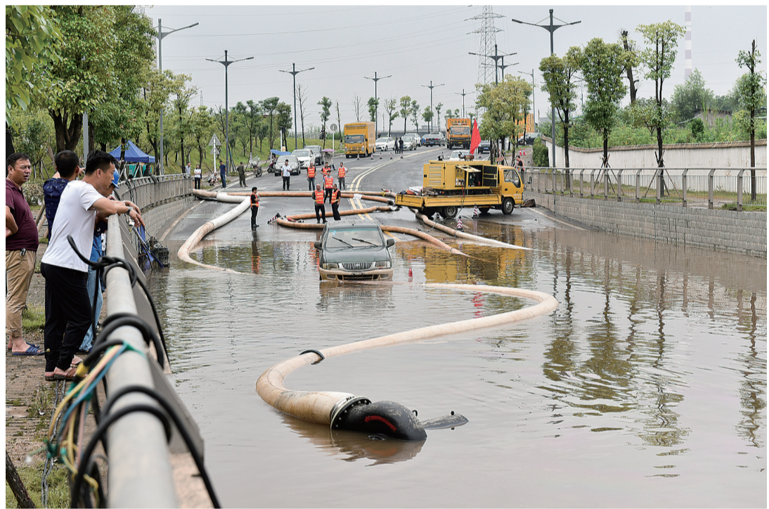
在新白石港路涵洞,多台水泵24小时排除积水。