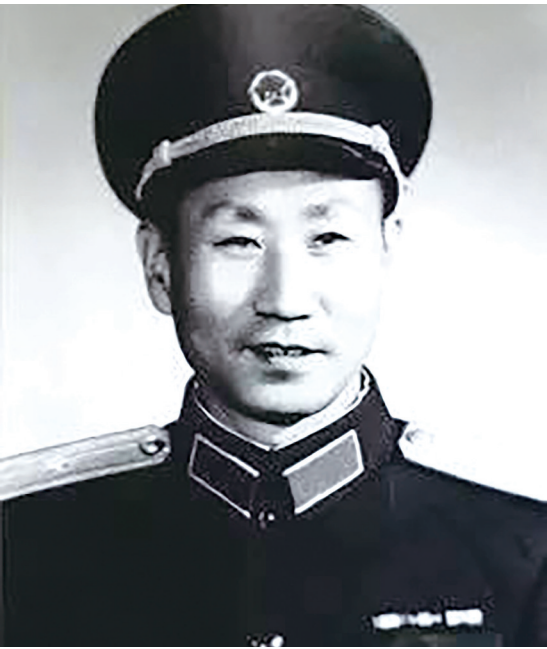
十七师五十一团报参参军。

1933年春,湘赣根据地缩小,红军减员,急需兵员补充时,也仔(三和)为月生恢复了团籍,把他送到红