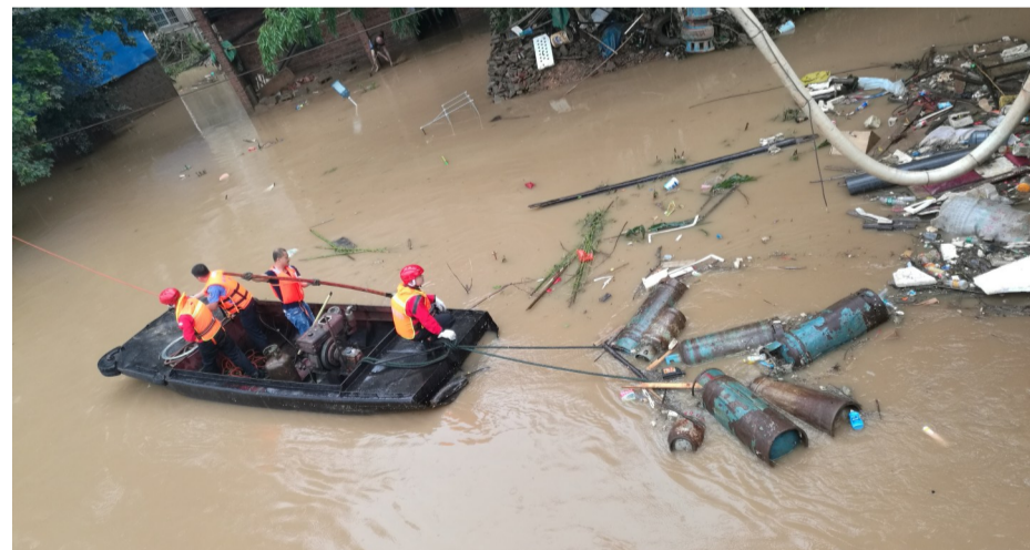
▲工作人员将搜寻到的液化气罐拖上岸

本报讯(记者 戴凇 通讯员 郭力嘉)昨日上午9时许,市交通运输局接到市防指紧急电话,天元区三门镇一厂内有一批液化气罐因洪水没来得及转移冲入湘江,市交通运输局海事等部门立即赶赴现场,遗失的气罐全部找回。