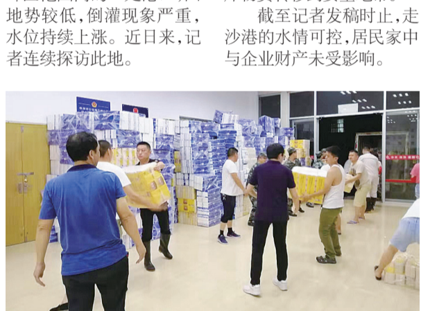
▲11日晚上,抢险人员在转移仓库物资

走沙港是龙母河在石峰区范围内的一处港口,因地势较低,倒灌现象严重,水位持续上涨。连日来,记者连续探访此地。