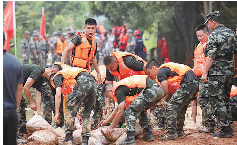
▲救援人员干堤现场抢险

7月11日晚上11时,经过200余名救援人员连续40多个小时的艰苦作业,涠口区南洲镇将军村干堤决口完成填堵,顺利实现合龙。目前,救援人员正在进行固堤工作。