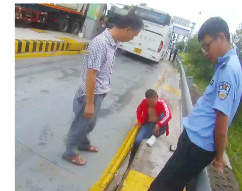
▲男子右脚卡在收费站通道缝隙