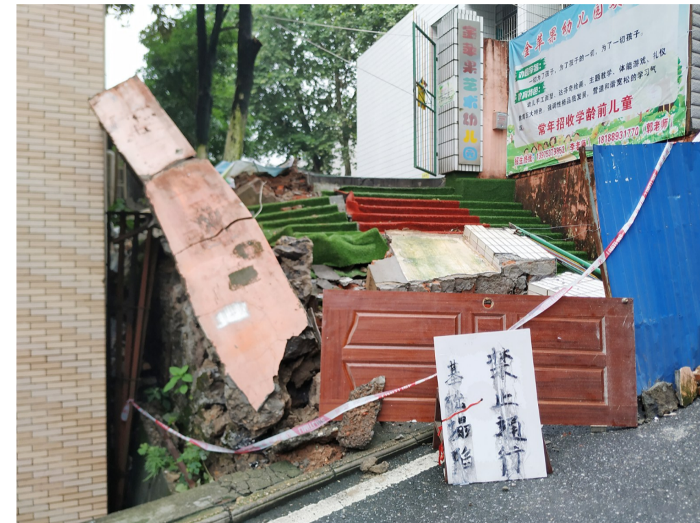
▲幼儿园护坡垮塌现场

9日上午7点左右,因连日大雨,荷塘区金苹果幼儿园的护坡发生垮塌,导致围墙和大门一同倒塌,所幸没有造成人员伤亡。