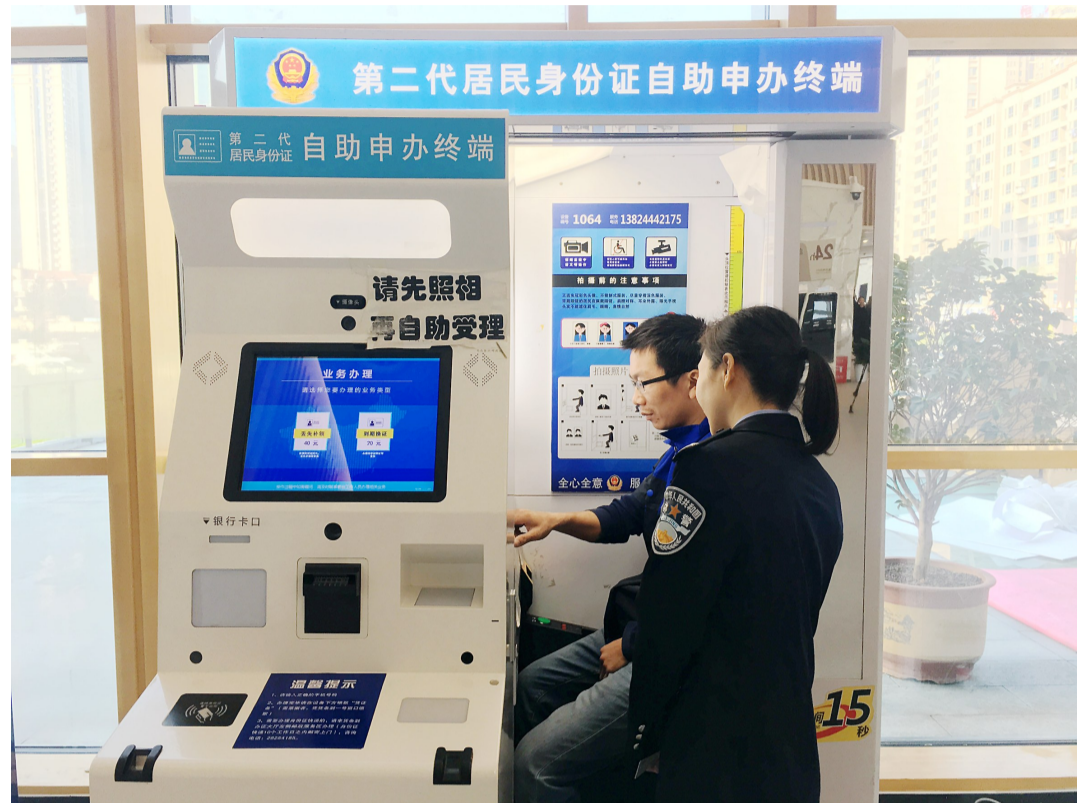
▲市民在市民中心方便快捷地办理证件

昨日,由市委宣传部(市政府新闻办)组织召开“壮丽70年 奋斗新时代”庆祝新中国成立70周年系列新闻发布会举行第二场,发布主题为:全市全面深化改革开放成特色亮点工作情况。