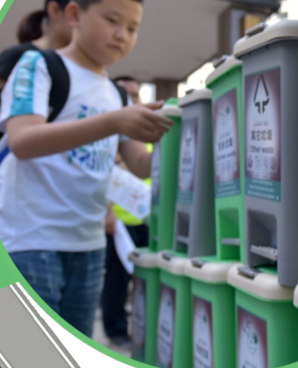
▲7月7日,在新疆乌鲁木齐市水磨沟区华凌公馆小区,居民领取分类垃圾桶

“我前面分好了,垃圾车一来又倒在一起拉走了”——过去推进垃圾分类的一大障碍,就是分类运输、分类处置的能力不够,未能形成闭环系统,在一定程度上挫伤了市民分类的积极性。解决这个问题,需要政府加大投资力度,以高标准的前端处理来呼应严格的前端分类。